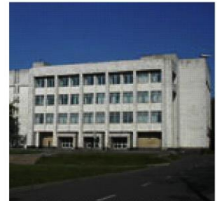
The Library building

M - станція метро “Політехнічний інститут” / Metro station ‘Politeknichnyi Institut’